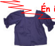
rövid ujjú blúz