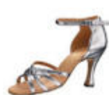
magas sarkú szandál