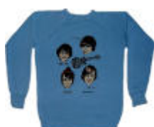
hosszú ujjú póló